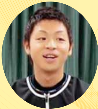
〈講師プロフィール〉

上智大学比較文化学部比較文化学科卒業。卒業後、横浜ベイスターズで国際管理担当兼通訳として2シーズン勤務し、2009年より阪神タイガース所属。現在、球団本部・国際スカウト担当兼通訳。